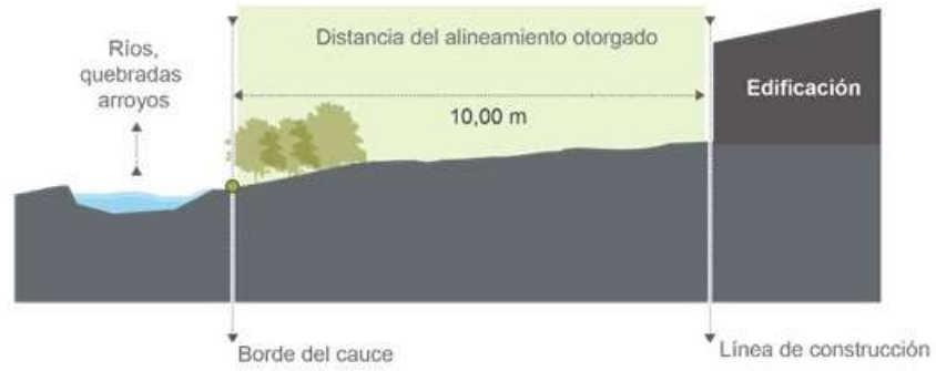
Figura 4. Diagrama de alineamiento en ríos quebradas y arroyos con pendientes < 40% en zona urbana