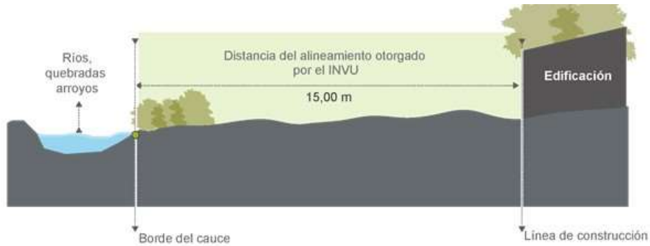
Figura 5. Diagrama de alineamiento en ríos quebradas y arroyos con pendientes < 40% en zona rural

6.1.3. Una franja en las riberas de lagos, embalses naturales, así como embalses artificiales construidos por el Estado y sus instituciones. Dicha franja será de 50,00 m medidos horizontalmente. Se exceptúan los lagos y embalses artificiales privados (ver figura 6)