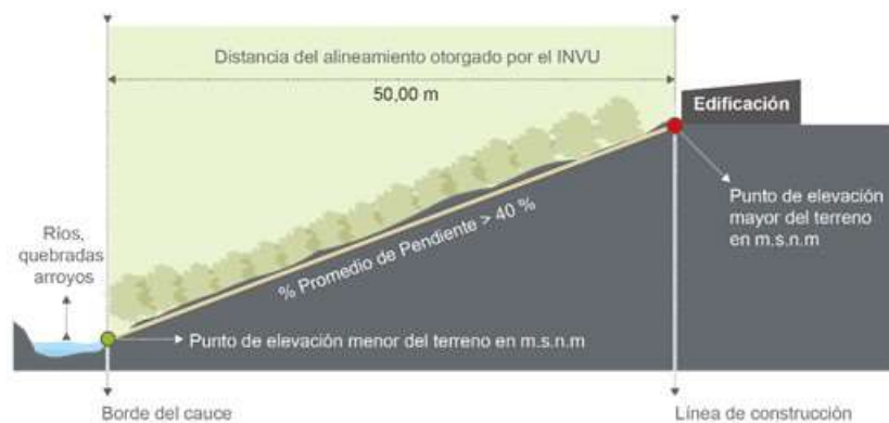
Figura 3. Diagrama de alineamiento en ríos quebradas y arroyos con pendientes > 40% en zona rural y urbana

6.1.2. Una franja a ambos lados en las riberas de los ríos, quebradas o arroyos. En zonas rurales esta franja es de 15,00 m y en zonas urbanas de 10,00 m, medidas horizontalmente, siempre que el terreno sea plano. Si el terreno es quebrado, la franja debe ser de 50,00 m horizontales. (ver figura 3, 4 y 5)