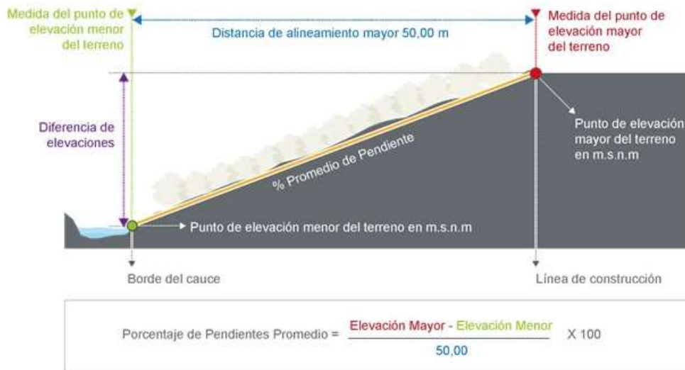
Figura 7. Diagrama de cálculo de pendientes en terrenos

Con base en los requisitos entregados por la persona interesada, el INVU debe verificar la documentación y determinar la distancia requerida para el alineamiento otorgado ya sea de 10,00 m, 15,00 o 50,00 m según corresponda el porcentaje de la pendiente y la ubicación del predio ya sea en área rural o área urbana.