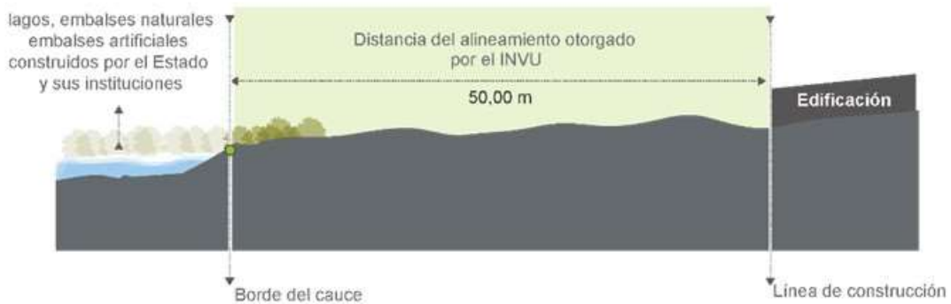
Figura 6. Diagrama de alineamiento en de lagos, embalses naturales, así como embalses artificiales construidos por el Estado y sus instituciones

6.1.3. Una franja en las riberas de lagos, embalses naturales, así como embalses artificiales construidos por el Estado y sus instituciones. Dicha franja será de 50,00 m medidos horizontalmente. Se exceptúan los lagos y embalses artificiales privados (ver figura 6)