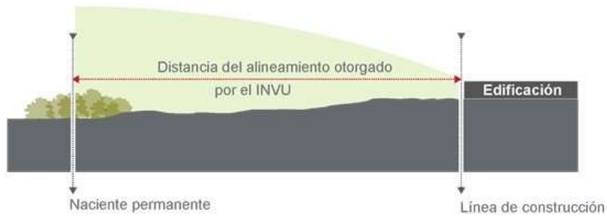
Figura 1. Diagrama en elevación de alineamiento en nacientes permanentes